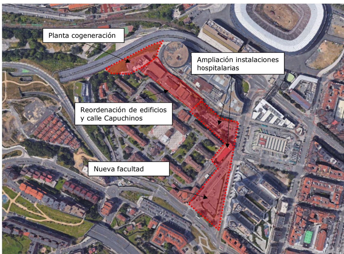
Ilustración 1. Localización de la zona de actuación

El ámbito del PEOU que en un principio sólo incluía una parcela para la implantación de la Facultad de Medicina y Enfermería de la UPV/EHU, se amplió para incorporar suelo que posibilitara la ampliación y mejora de las instalaciones actuales del Hospital de Basurto, incorporando suelo para la ordenación de nuevas edificaciones, reordenando los edificios existentes frente a la calle Capuchinos, y facilitando la ampliación de la planta de cogeneración actual, tal y como se muestra en la siguiente imagen.