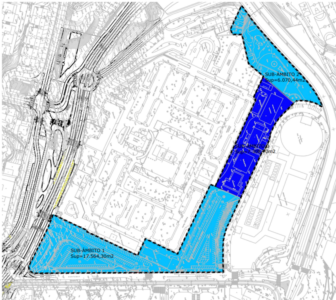
Ilustración 2. Imagen del plano I-02 de este documento

Por tanto, la superficie total del ámbito para la modificación del Plan Especial es de 30.943,44m 2 .